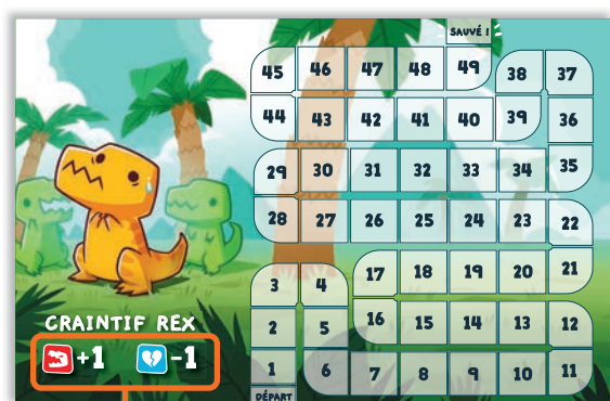
CAPACITÉS DE DINOSAURE

Les capacités de chaque Dinosaur sont indiquées dans le coin inférieur gauche du plateau de joueur.